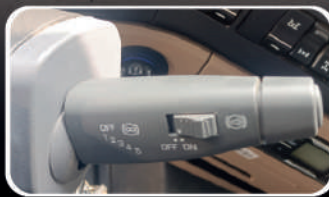
INTARDER 3, de 5 Tiempos