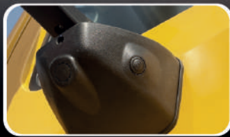
Kit Monitor de 4 Cámaras